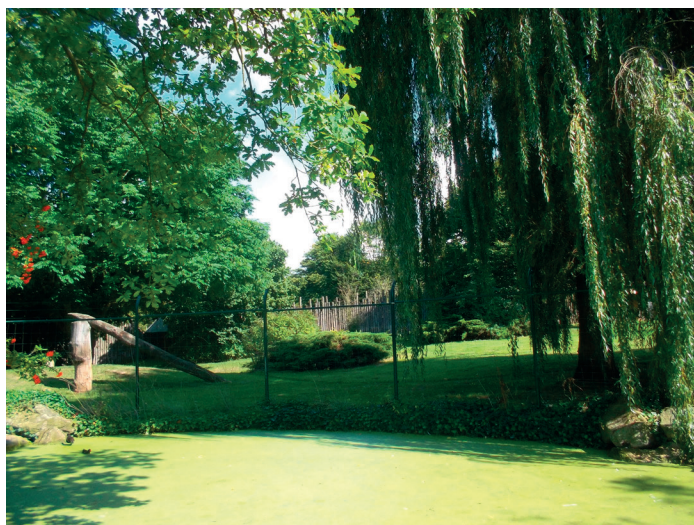
Außenteil des Gepardengeheges