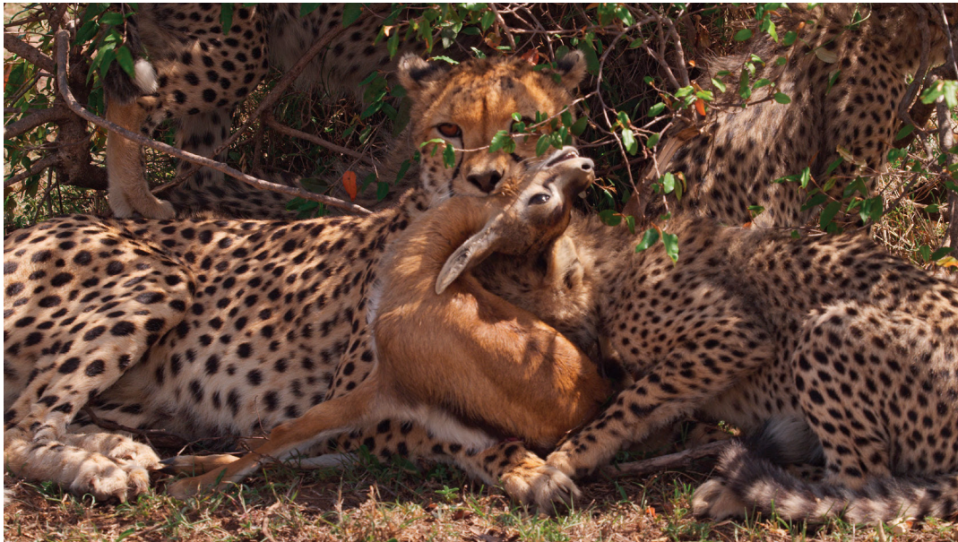
Maleika und ein Junges mit einer gerissenen Antilope