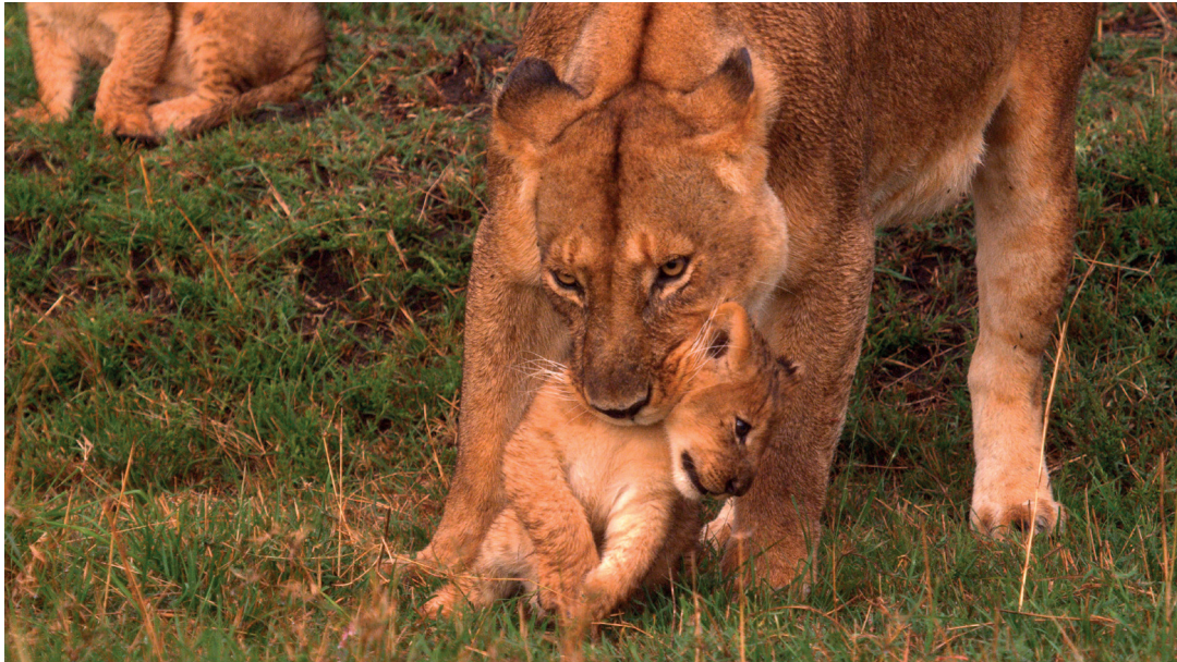
Transport eines Löwenjungen