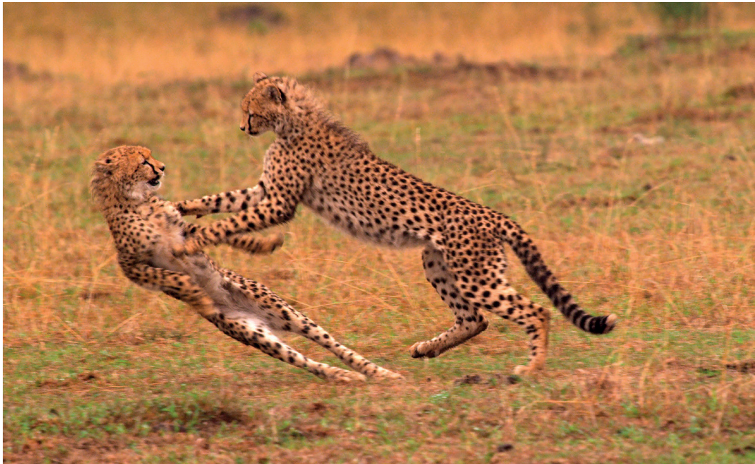
Gepardenjunge beim Spielen