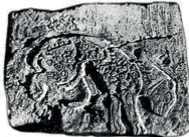
Abb. 1 Leopard (nordsyrisches Sockelrelief; 9. Jh. v. Chr.).