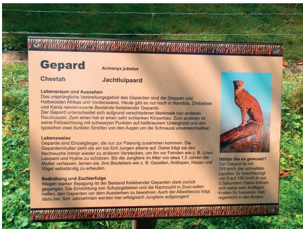
Kurzporträt zur Lebensweise eine Geparden, Allwetterzoo Münster

Diese ohnehin eingeschränkten Bedingungen können nur wenige Zoos in Deutschland bieten. Einer davon ist der Allwetterzoo in Münster/Westfalen, wo zudem seit vielen Jahren im Rahmen des europa- bis weltweiten EEP (Europäisches Erhaltungszuchtprogramm) Geparden gezüchtet werden.