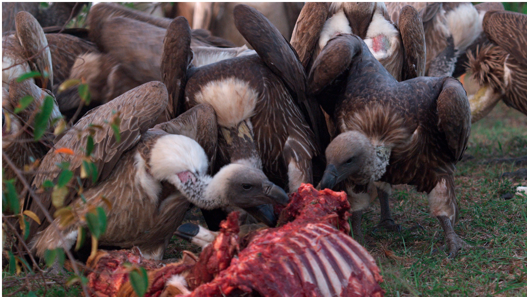
Geier beim Fressen