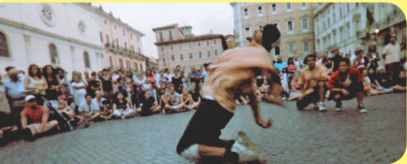
Rom - Strassenshow