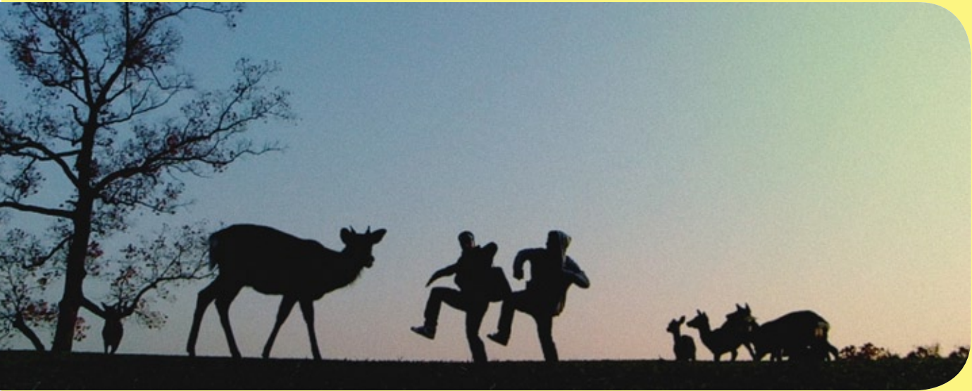
Japan - Tanz mit den Rehen